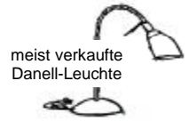
meist verkaufte Danell-Leuchte

Die Tischleuchte "Lichtdusche" findet vielfältige Anwendung - am abendlichen Leseplatz, am Nachttisch oder bei Arbeiten, wo gezieltes Licht benötigt wird. Für den Büroarbeitsplatz, bei dem eine größere Schreibtischfläche ausgeleuchtet werden soll, empfehlen wir die Werkleuchte, die wir in den Farben Silber, schwarz und weiß produzieren.